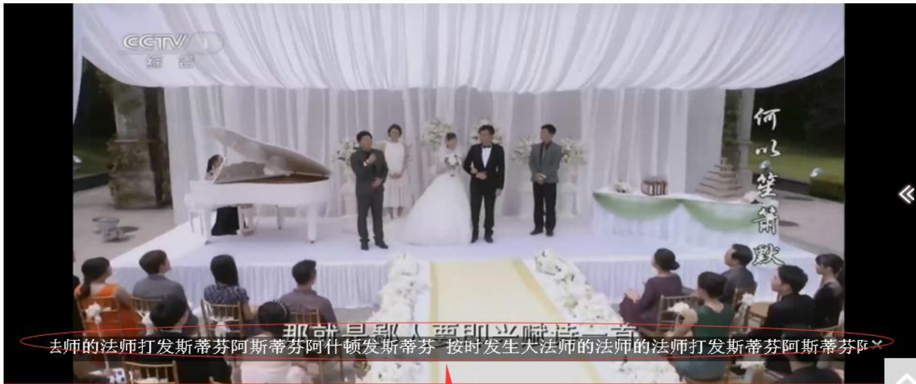
这是成功添加文字广告后的效果